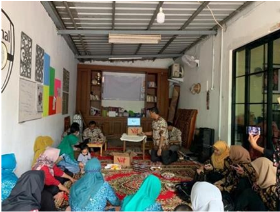
Gbr 4. Foto Dokumentasi Kegiatan 5