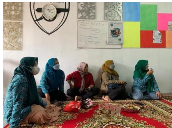
Gbr 3. Foto Dokumentasi Kegiatan 2