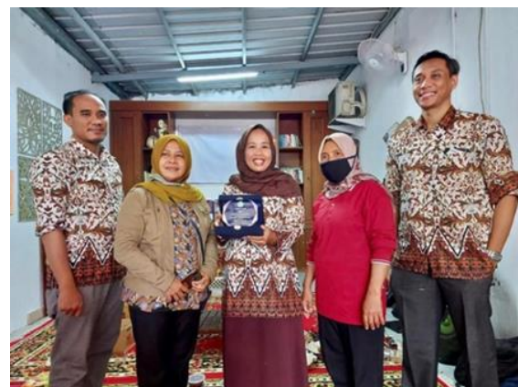
Gbr 4. Foto Dokumentasi Kegiatan 3