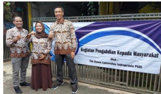
Gbr 2. Foto Dokumentasi Kegiatan 1