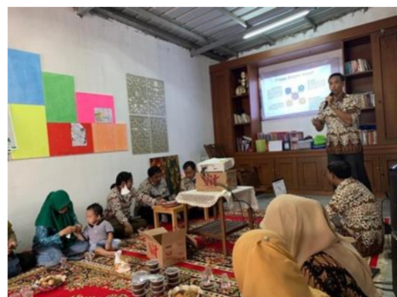
Gbr 3. Foto Dokumentasi Kegiatan 4