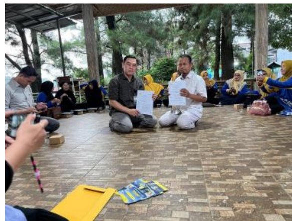
Gbr 2. Dokumentasi Kegiatan