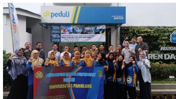
Gbr 3. Dokumentasi Kegiatan