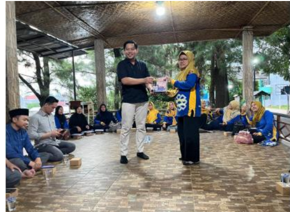
Gbr 1. Dokumentasi Kegiatan