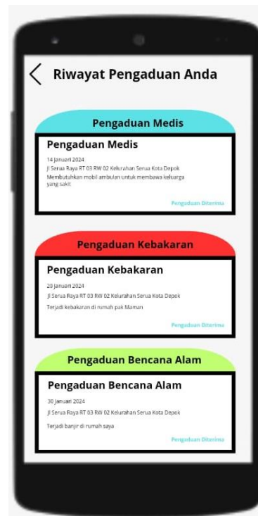
Gambar 5. Tampilan Menu History Pengaduan

Menu berikut digunakan untuk melihat semua history pengaduan yang telah dilaporkan oleh pengguna,