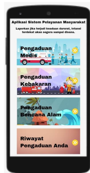
Gambar 2. Tampilan Halaman Menu Pengaduan

Langkah pertama adalah user interface halaman utama. Halaman ini dibuat dengan memanfaatkan aplikasi android studio. Halaman utama Aplikasi pelayanan masyarakat bisa kita lihat pada gambar 2. User interface terdiri dari beberapa menu, diantaranya Pengaduan Medis, Pengaduan Kebakaran, Pengaduan Bencana Alam dan Pengecekan History Pengaduan.