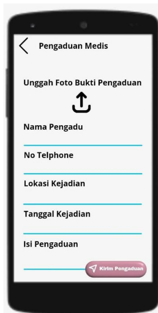
Gambar 3. Menu Pengaduan Media

Tahap selanjutnya adalah halaman menu input pengaduan kebakaran. Pada menu ini pengguna dapat melaporkan kejadian terkait terjadinya kebakaran dan membutuhkan pemadam kebakaran dan sejenisnya.