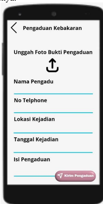
Gambar 4. Tampilan Menu Input Pengaduan Kebakaran

Tahap selanjutnya adalah halaman menu input pengaduan kebakaran. Pada menu ini pengguna dapat melaporkan kejadian terkait terjadinya kebakaran dan membutuhkan pemadam kebakaran dan sejenisnya.