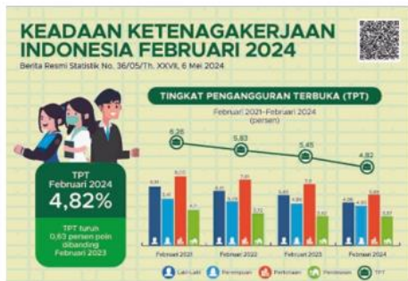
Gambar 1.2 Data Tingkat Pengangguran Terbuka

Situasi ini mendorong masyarakat Indonesia untuk mencari cara inovatif guna meningkatkan daya saing dan memperbaiki perekonomian. Oleh karena itu, tidak mengherankan jika saat ini banyak pelaku usaha di sektor Usaha Mikro, Kecil, dan Menengah (UMKM) muncul sebagai salah satu pilar penting dalam ekonomi rakyat.